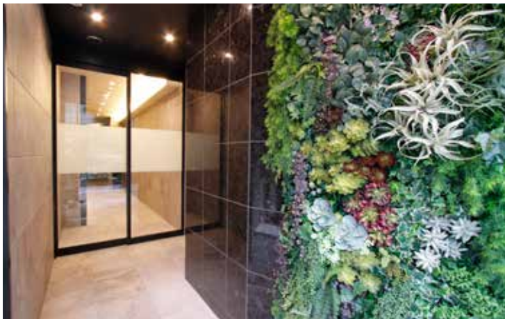
エントランス 豊かな緑のファサードは一層目を引きます