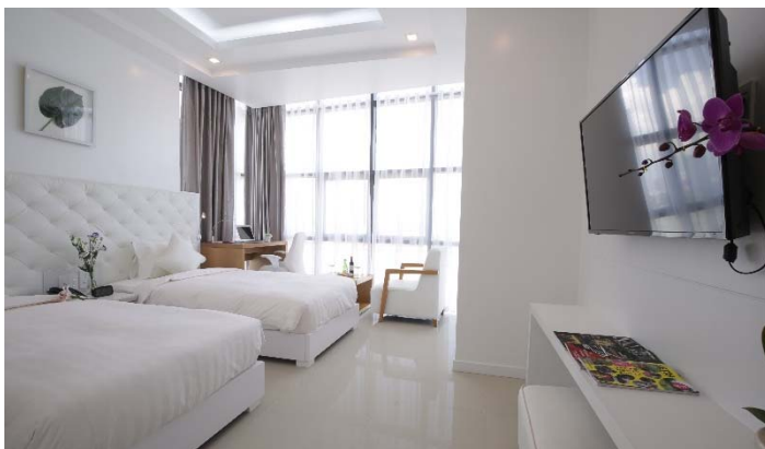
<客室（窓からはハン川が臨めます）>