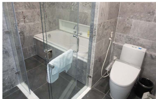
<ゆったりとしたバスルーム>