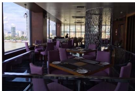
<最上階のレストラン>