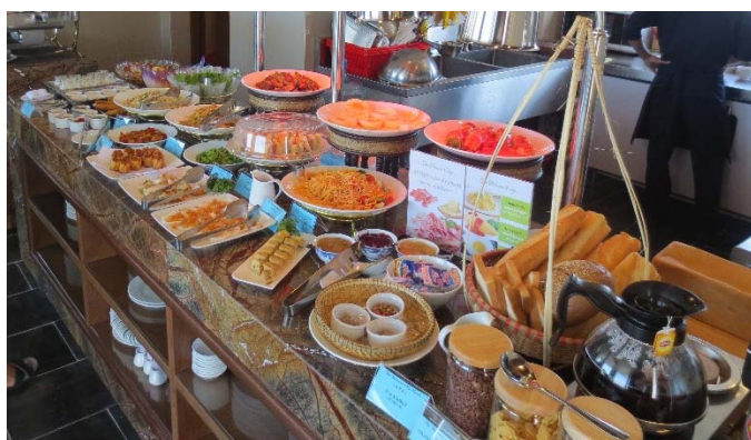
<種類豊富なバイキング（写真は朝食です）>