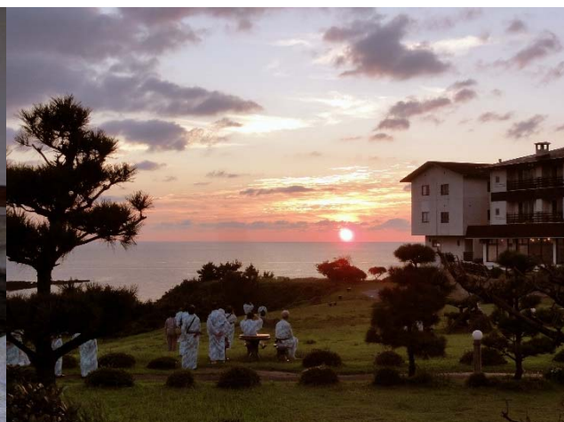
〔庭園から望む夕陽〕