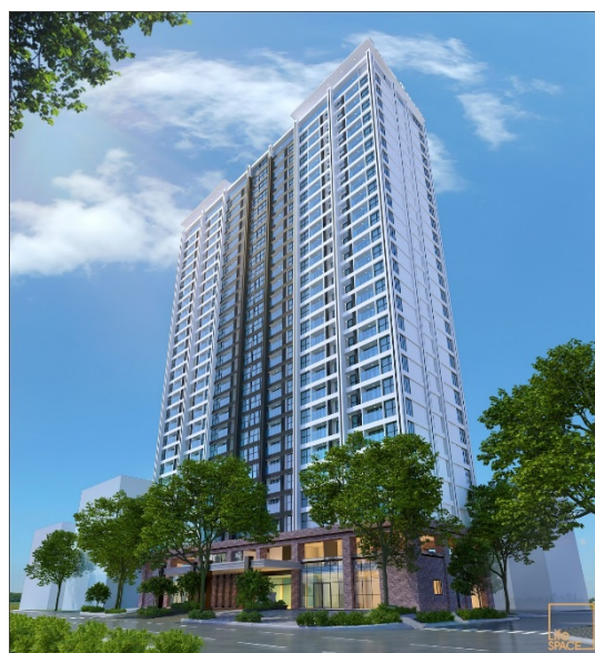
「HIYORI Garden Tower」の完成予想パース

所在地： Lot2-A2 Vo Van Kiet Phuong An Hai Dong Quan Son Tra Thanh pho Da Nang ダナン市ソンチャ区 アンハイドン町 ヴォーバンキエト通り Lot2-A2 土地面積： 2,077.6 m 2 建物構造： 地下2階・地上28階建 延床面積： 33,053 m 2 用途： 住宅、店舗（幼稚園、プール、 フィットネス、コミュニティ広場、 駐車場） 総戸数： 306戸 （2LDK / 65.9 m 2 ～70.1 m 2 ） 駐車場等： 駐車場96台・駐輪場167台 竣工予定： 2019年10月予定 ※モデルルームオープン： 本年5月末（予定）