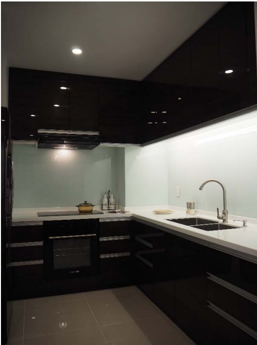
<モデルルーム キッチン>