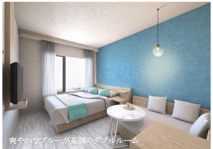
爽やかなブルーが基調のダブルルーム