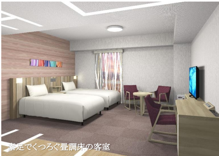
素足でくつろぐ畳調床の客室

全176室の客室は、長野県の名産である白樺や民芸品などをモチーフにした趣のある内装を設え、長期滞在を快適にするキッチン、電子レンジ、洗濯機などの家電付き客室や、素足で過ごすいただける畳調の床材を用い、お客様へ快適で心地よい空間をご提供いたします。また、大浴場にはサウナ付きの人工温泉をご用意し、お仕事や旅の疲れを存分に癒していただけます。さらに大小の会議室も完備しており、企業研修や地域の会合など、様々なシーンでご利用いただける充実の施設が皆様をお迎えいたします。