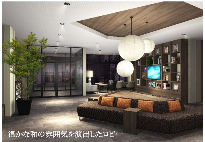
温かな和の雰囲気 연출したロビー