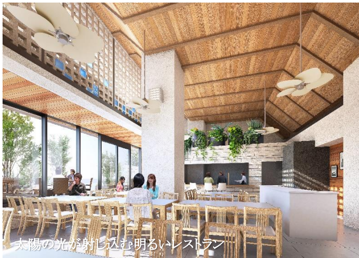
太陽の光が射し込む明るいレストラン

ダブルルームを中心とした全 111 室の客室には、キッチンや電子レンジ、洗濯機を備えた長期ご滞在に適した客室や、大きなコーナーソファを設けた客室などをご用意しております。また、レストランは沖縄食材を多用したイタリアンやメキシカン等多国籍料理を予定しており、こだわりのお食事をお楽しみ頂くと共に、夜はバーも併設し楽しいホテルへと滞在を彩ります。「思いと出会いをつなぐ」新しい価値に出会えるホテルとして、当ホテルを起点に新しい旅をクリエイトする魅力的な体験をご提供いたします。