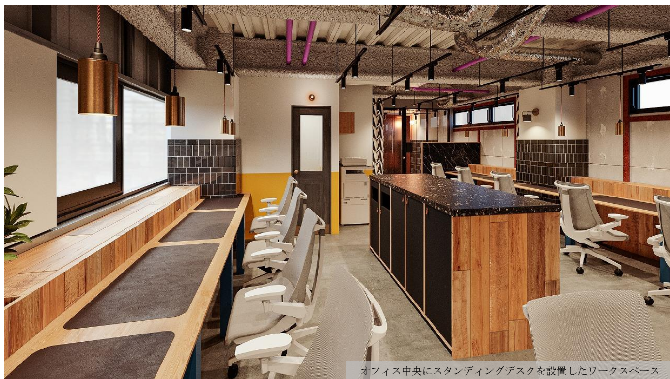
オフィス中央にスタンディングデスクを設置したワークスペース