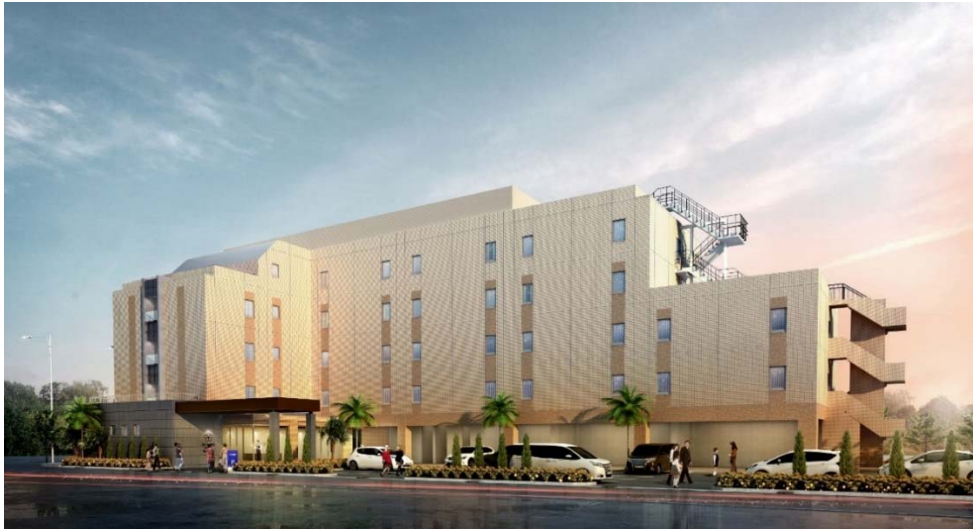
<外観完成イメージ>

開業：平成29年4月28日（金） 所在地：千葉県浦安市東野二丁目25番8号 交通：首都高速湾岸線「浦安ランプ」から車で1分（800m） JR京葉線・武蔵野線「舞浜駅」から無料送迎バスで5分 客室数：80室 付帯施設：レストラン