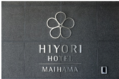
HIYORI HOTEL MAIHAMA