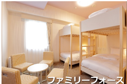
ファミリーフォース