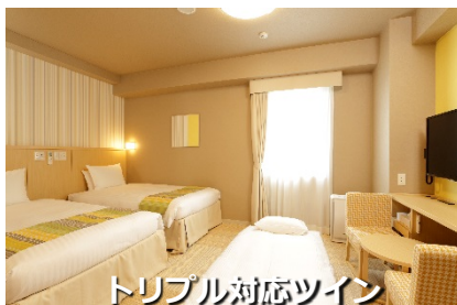
トリプル対応ツイン