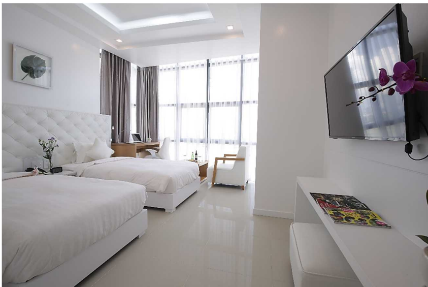
明るく清潔な客室

世界的に注目を集める人気観光都市、ベトナム中部のダナンにおいて、2016年8月に開業した当社の海外第1号ホテル「The Blossom City」は、自社ブランドである「日和ホテルズ&リゾーツ」のカジュアルブランド「たびのホテル」として新たに生まれ変わりました。都市中心部の立地でカジュアルな旅を満喫できる「TABINO」ブランドホテルの一員として、コンセプトである「心温かいホテル」をより深く追求してまいります。