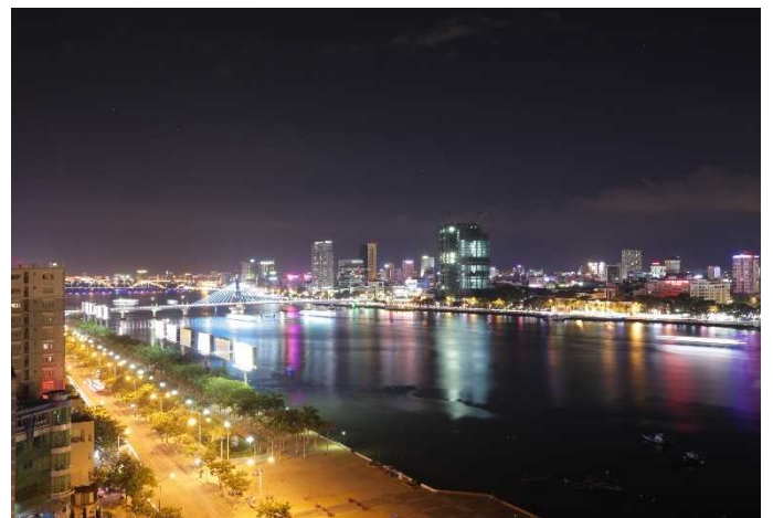
室内からの夜景 (左奥 ドラゴンブリッジ)