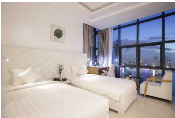
ハン川の夜景を望む客室