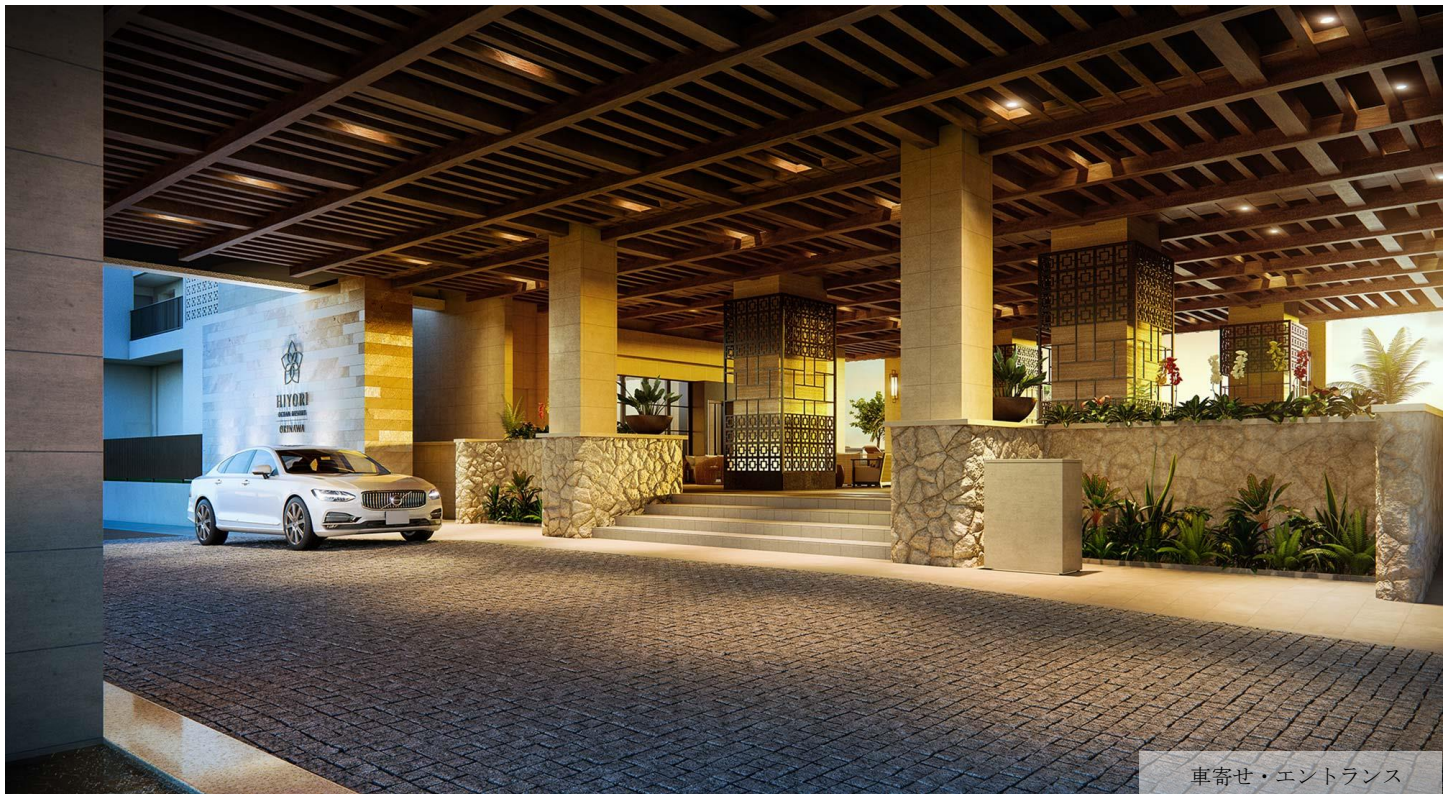
車寄せ・エントランス

掲載の情報は計画段階のものであり、客室のレイアウト、家具等の詳細については、今後の設計、施工により変更になる可能性があります。本ニュースリリース内イメージは、一部完成予想CGを使用しております。