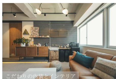
こだわりの内装とインテリア