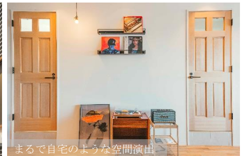
まるで自宅のような空間演出