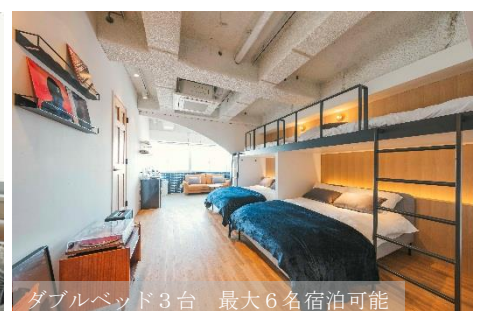
ダブルベッド3台 最大6名宿泊可能