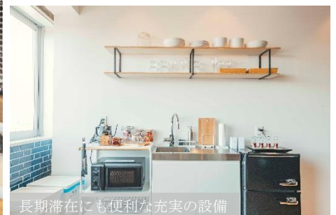
長期滞在にも便利な充実の設備