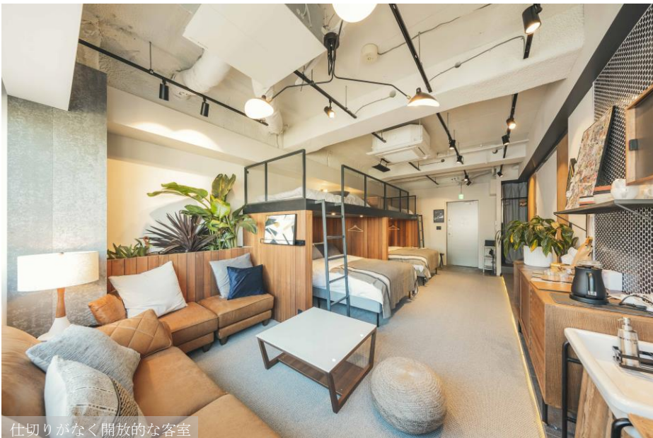
仕切りがなく開放的な客室

【スリープオーバーエクスペリエンス】と冠する「illi Shimokitazawa」は、約 50㎡の空間にあえて仕切りを設けず、コミュニケーションをより活性化させるテーマをもたせた客室で構成しており、旅先でも我が家のように友人との気兼ねない「お泊まり会(スリープオーバー)」のような居心地のよさを感じていただけるような空間づくりにこだわりました。