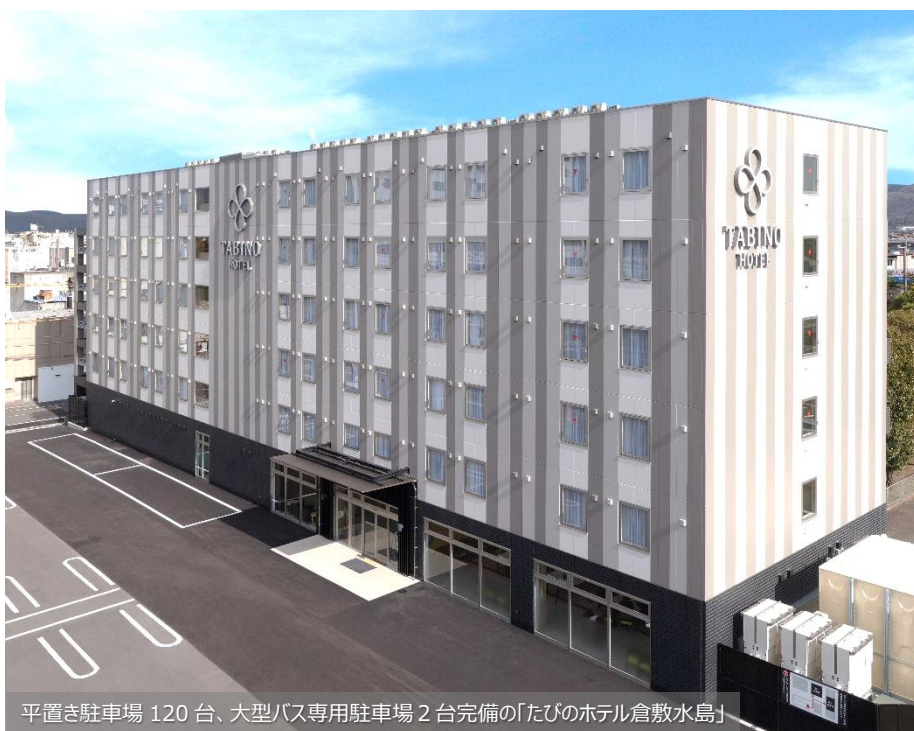
平置き駐車場 120 台、大型バス専用駐車場 2 台完備の「たびのホテル倉敷水島」