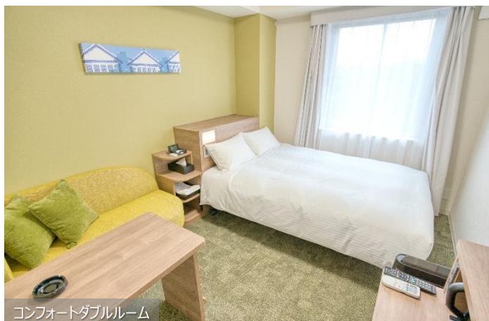
コンフォートダブルルーム