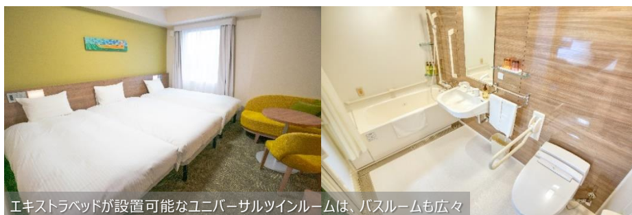
エキストラベッドが設置可能なユニバーサルツインルームは、バスルームも広々