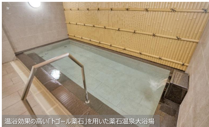
温浴効果の高い「トゴール薬石」を用いた薬石温泉大浴場

当ホテル最大の特徴は、温浴効果が高く多種類のイオンを含む「トゴール薬石」を用いた薬石温泉大浴場「天領の湯」です。仕事や旅でお疲れの身体だけでなく、心までも芯から温め、ゆっくり癒していただけます。明るく清潔な大浴場で、リラックスタイムを存分にお楽しみください。