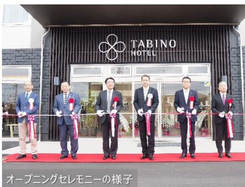
オープニングセレモニーの様子