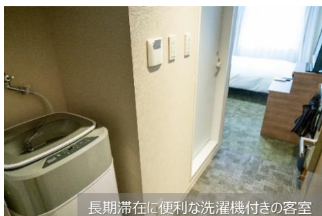
長期滞在に便利な洗濯機付きの客室