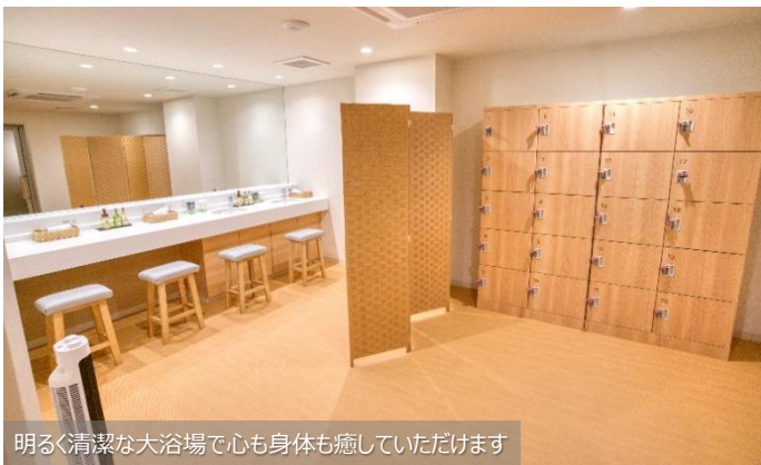
明るく清潔な大浴場で心も身体も癒していただけます