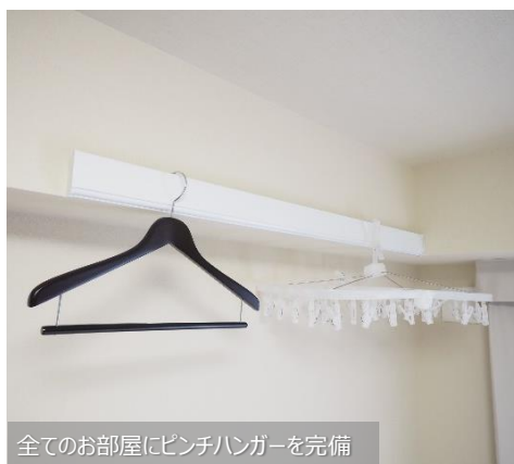
全てのお部屋にピンチハンガーを完備