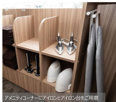
アメニティコーナーにアイロンとアイロン台をご用意