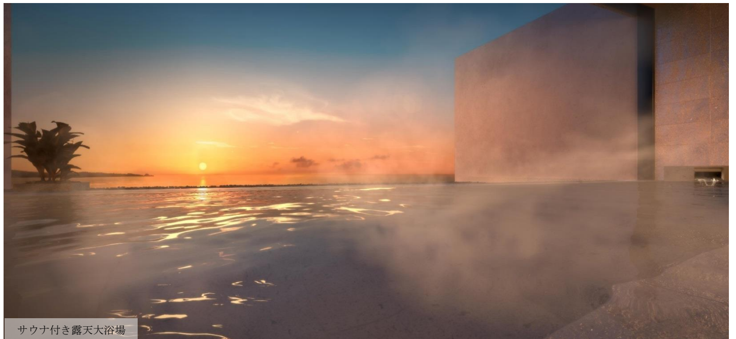
サウナ付き露天大浴場

プールやビーチで泳いだ後は、サウナ付の露天大浴場で至福のひと時をお過ごしください。水平線に沈む夕陽を眺めながらのリラックスタイムは、心も身体も解きほぐします。