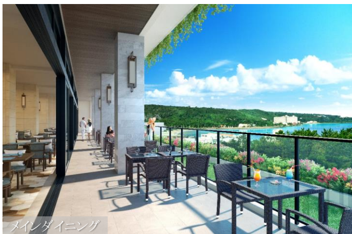
メインダイニング

海を眺めながらお食事をお楽しみいただけるオープンテラスを備えたメインダイニングをはじめ、鉄板焼、BBQエリア、DELI&SWEETS、Café & Bar、プールサイドバー、インルームダイニングと、お客様のご滞在に合わせ、様々なご要望に寄り添う7種類のダイニングをご用意いたしました。沖縄の旬の食材をふんだんに取り入れた、当ホテルならではの食事をご堪能ください。