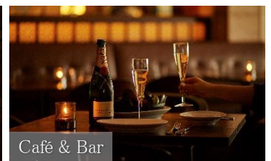
Café &amp; Bar