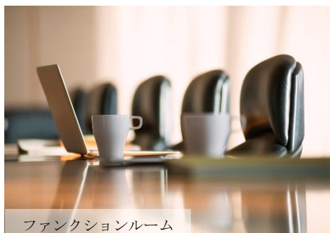
ファンクションルーム