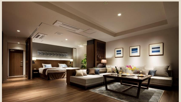
モデルルーム写真