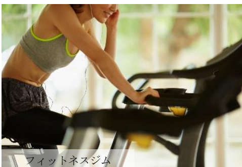
フィットネスジム

旅の疲れを癒すエステサロン、気持ちよく汗を流すフィットネスジム、さらにコンビニエンスストアやファンクションルーム（会議室）、天候を気にせず利用できる建物内駐車場など、お客様の滞在を彩る充実のホテル施設を完備しております。心ゆくまで「沖縄時間」をお楽しみくださいませ。