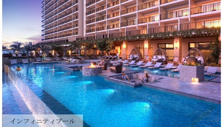
インフィニティプール