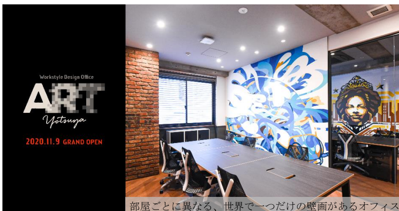
部屋ごとに異なる、世界で一つだけの壁画があるオフィス