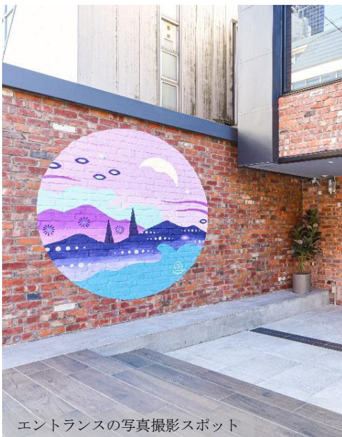
エントランスの写真撮影スポット

「A YOTSUYA」のテーマは【日本初・アートで部屋を選ぶシェアオフィス】。新進気鋭の日本人アーティスト総勢10名の方に参加いただき、シェアオフィス22室それぞれの部屋の壁面に「ここにしかない」「世界で一枚だけ」の作品を描いていただきました。