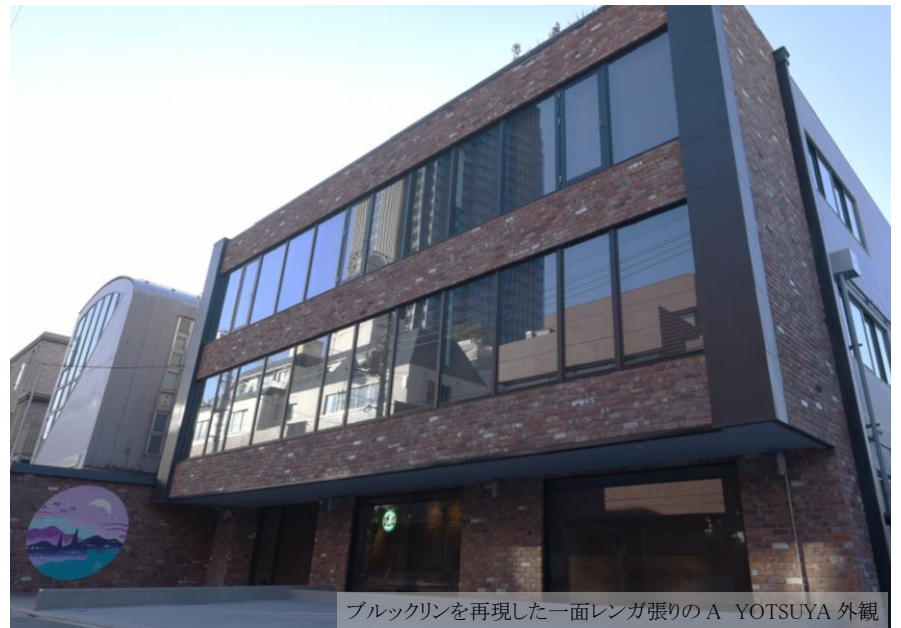
ブルックリンを再現した一面レンガ張りのA YOTSUYA 外観