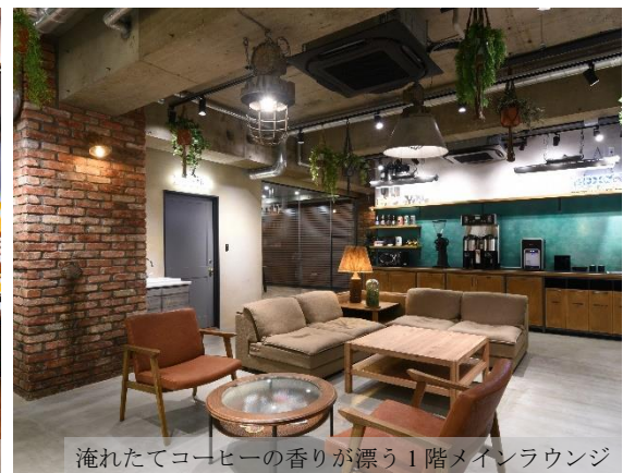
淹れたてコーヒーの香りが漂う1階メインラウンジ