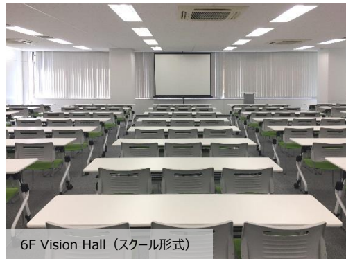
6F Vision Hall (スクール形式)