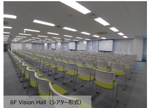
6F Vision Hall (シアター形式)