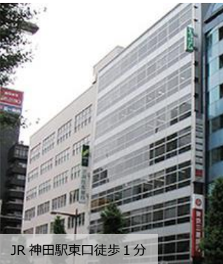
JR 神田駅東口徒歩1分