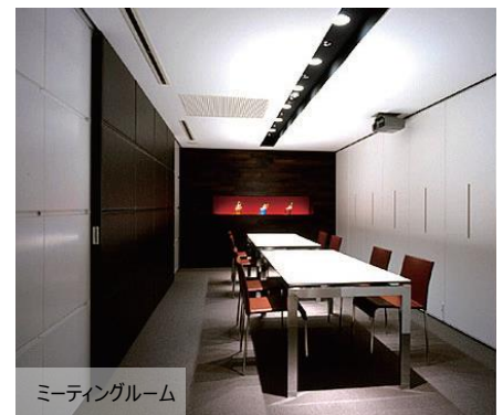
ミーティングルーム