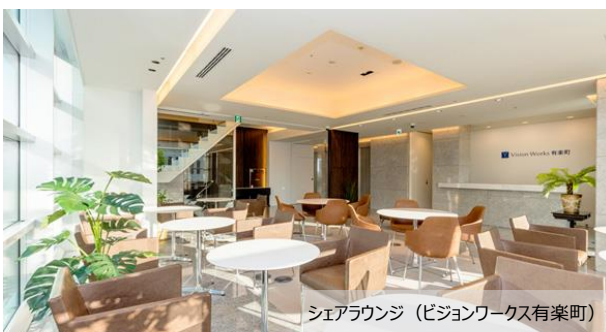
シェアラウンジ (ビジョンワークス有楽町)