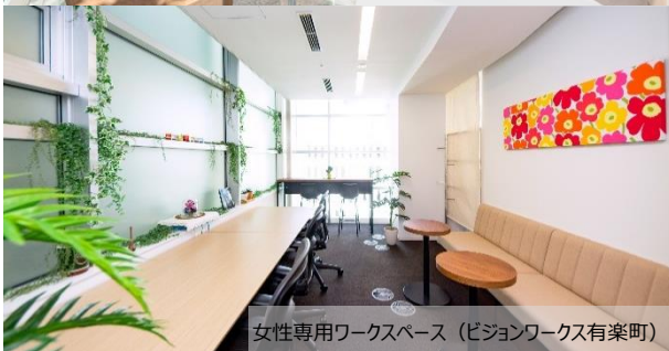
女性専用ワークスペース (ビジョンワークス有楽町)