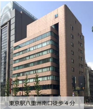
東京駅八重洲南口徒歩4分