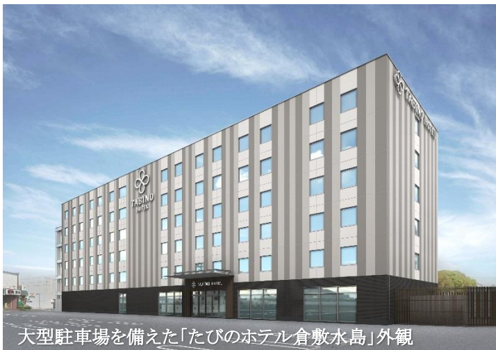
大型駐車場を備えた「たびのホテル倉敷水島」外観

当社および連結子会社であるサンフロンティアホテルマネジメント株式会社は、2020年2月1日に開業を予定している「 たびのホテル倉敷水島 」の宿泊ご予約承りを開始いたしましたので、お知らせいたします。