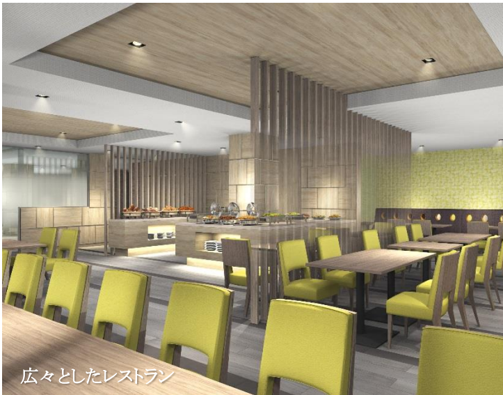
広々としたレストラン

さらにレストランでは岡山県の B 級グルメを集めた「大満足モーニング」など、この地域ならではのメニューを企画しています。「たびのホテル倉敷水島」は、心温かい従業員によるおもてなしで、お客様お一人おひとりに寄り添い、パーソナルなサービスと癒しの時間、空間をご提供させていただくことを通して、「また帰ってきたいホテル」を目指してまいります。