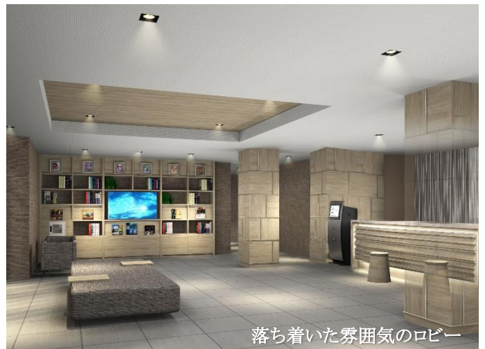
落ち着いた雰囲気のリビー

「たびのホテル倉敷水島」は、自社ホテルブランド「日和（ひより）ホテルズ&リゾーツ」のカジュアルブランドであり、手軽に旅を楽しみたい方やビジネスで滞在する方へ向けた宿泊特化型ホテル「たびのホテル（TABINO HOTEL）」の国内3号店として、岡山県倉敷市水島に誕生いたします。