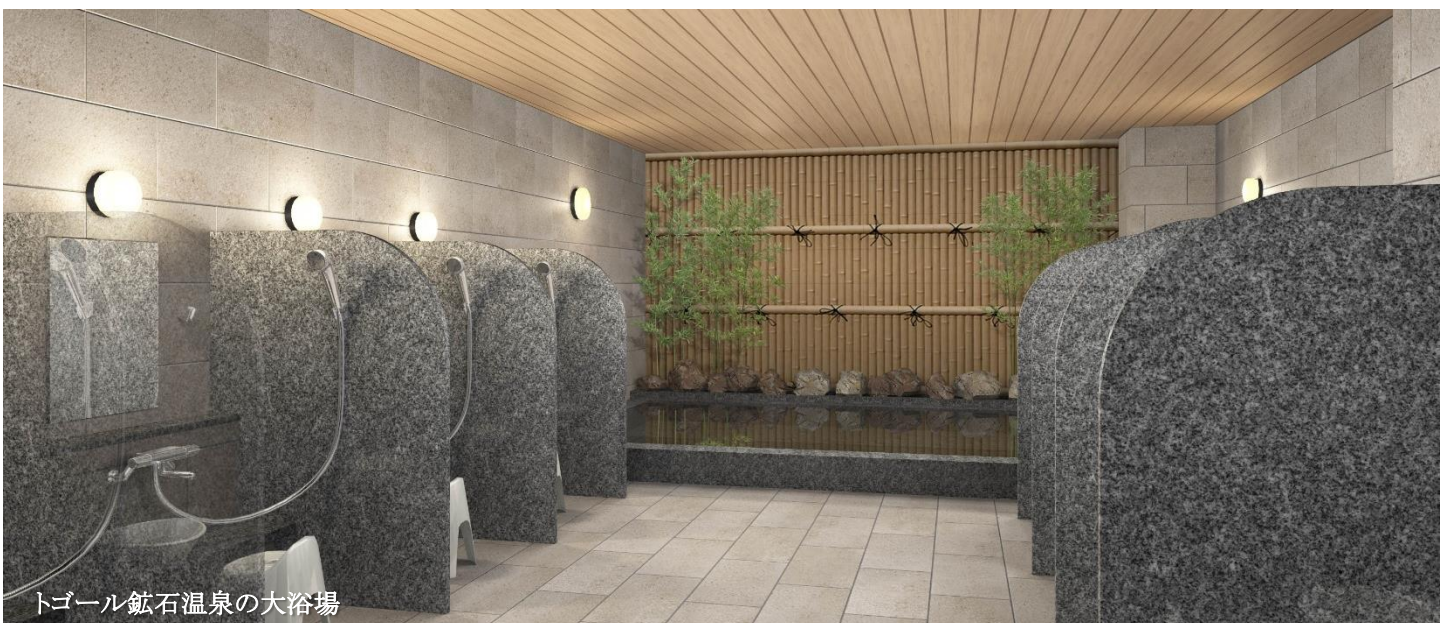
トゴール鉱石温泉の大浴場