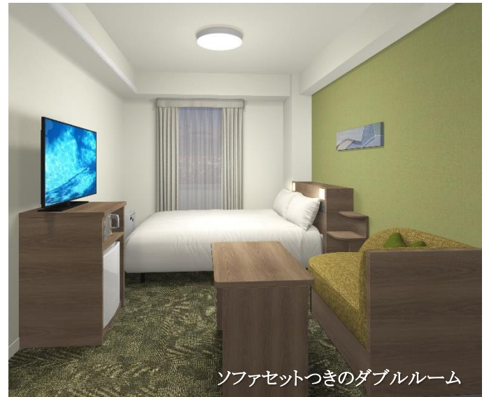
ソファセットつきのダブルルーム