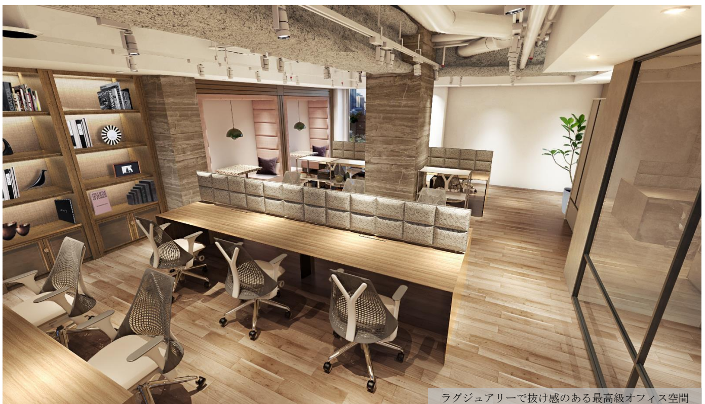
ラグジュアリーで抜け感のある最高級オフィス空間