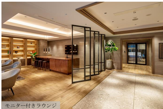
モニター付きラウンジ

1階から12階の各オフィスフロアは、内装デザインはもとより、一つひとつの素材にもこだわり、床材には、賃貸オフィスでは珍しい無垢材のフローリングを使用しています。また、手に触れる部分にはレザーやファブリックをあしらい、五感を刺激する様々な工夫を施しています。オフィス内は、自然光が降り注ぎ緑豊かな植物が放つ生き生きとした生命力あふれる空気感を大切にしました。