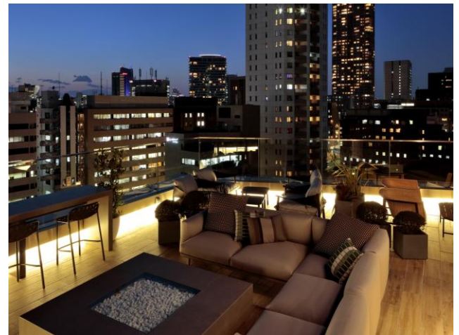
+SHIFT NOGIZAKA ルーフトップガーデン