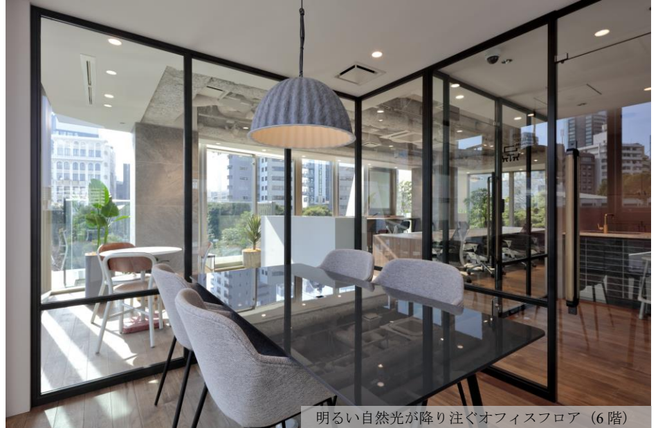
明るい自然光が降り注ぐオフィスフロア（6階）

1階から12階の各オフィスフロアは、内装デザインはもとより、一つひとつの素材にもこだわり、床材には、賃貸オフィスでは珍しい無垢材のフローリングを使用しています。また、手に触れる部分にはレザーやファブリックをあしらい、五感を刺激する様々な工夫を施しています。オフィス内は、自然光が降り注ぎ緑豊かな植物が放つ生き生きとした生命力あふれる空気感を大切にしました。