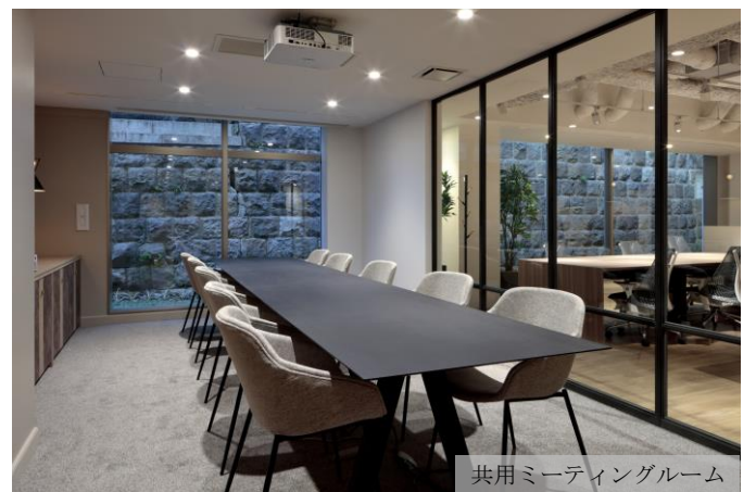
共用ミーティングルーム

1階のパブリックエリアには、モニター付きラウンジとプロジェクター付き共用ミーティングルーム（10席）を設け、イベントの開催や大人数の会議にもご活用いただけます。さらには、最上階の13階に、解放感あふれるルーフトップガーデンを設けました。気分転換のリフレッシュの場として、ご入居企業様同士の交流の場として、自由にご利用いただけます。