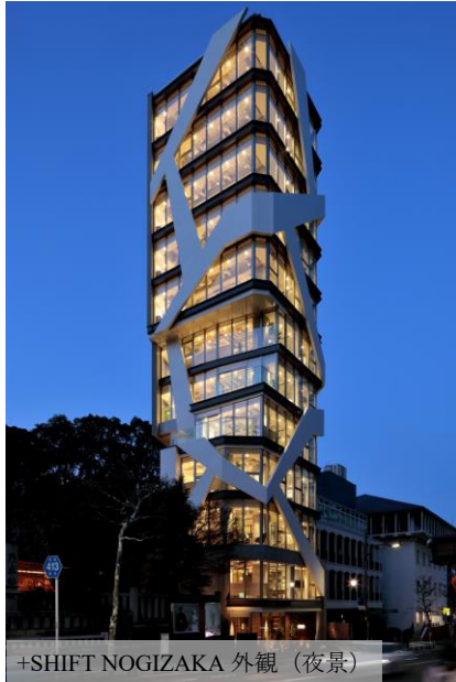
+SHIFT NOGIZAKA 外観（夜景）

東京メトロ千代田線「乃木坂」駅1番出口を出るとすぐに目を惹くアイコン的な外観の+SHIFT NOGIZAKAは、当社の新築オフィスプロジェクトとしてゼロから立ち上げ、2021年3月31日に竣工いたしました。特徴的な外観のデザインは“根”をモチーフにしており、隣接する乃木神社の木々の有機的な形状と一体となった存在感をあたえています。深く根を張り、大きく成長していく木々や植物たちのように、あらゆる企業がこのビルを土壌とし、大きく成長する未来をイメージし、私たちのオフィスビル事業の理念である「テナント企業様の成長を加速させるオフィス」を表現しました。