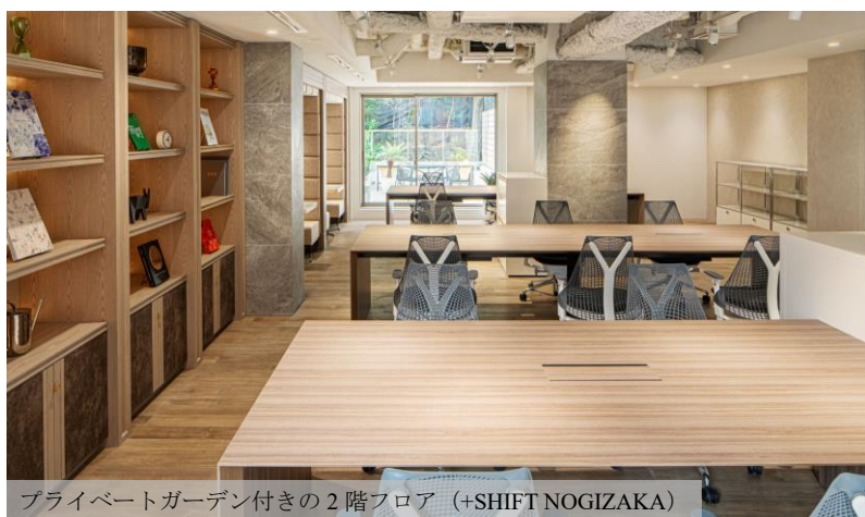
プライベートガーデン付きの2階フロア (+SHIFT NOGIZAKA)