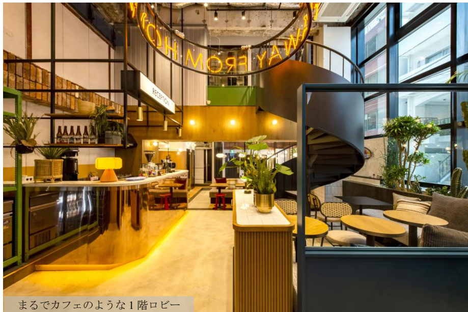
まるでカフェのような1階ロビー

まるでカフェのような本格的コーヒーマシンのあるレセプションを備えた1階ロビーには、入居企業様が自由にご利用いただける空間が広がります。一見公衆電話ボックスを思わせるスタイリッシュなテレカンブースやモニター付き会議室、ベンチスタイルブースなど、雰囲気を変えながらミーティングを行えます。ロビーでは、常時ドリップコーヒーを無料提供し、さらに、1日2回のスペシャルコーヒータイムとして、コミュニティマネージャーが1杯ずつ淹れるこだわりのコーヒーをご提供させていただきます。このようなイベントを通じ、ご入居企業様が毎日決まった時間にロビーに集い顔を合わせるきっかけを創出します。