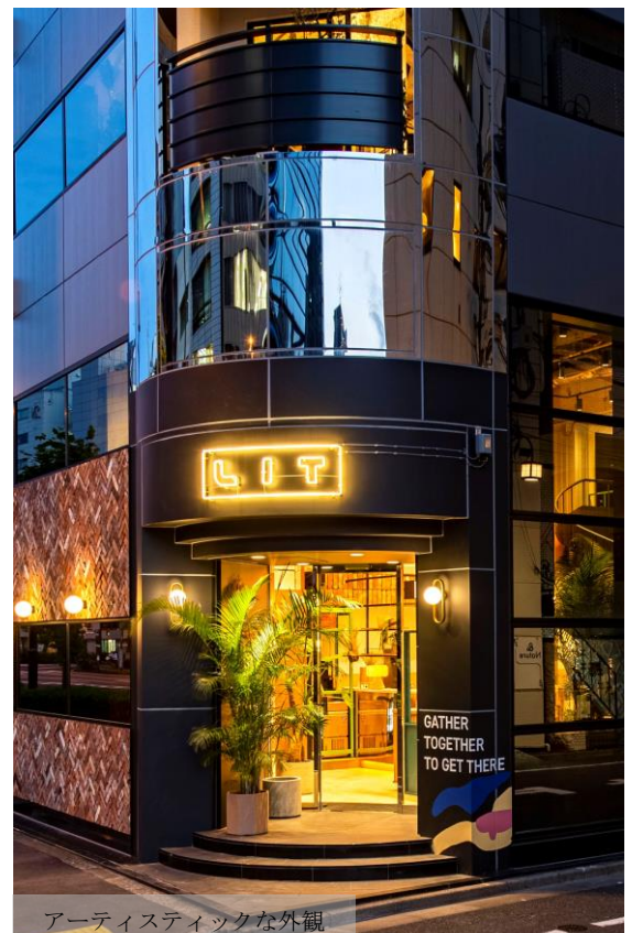
アーティスティックな外観