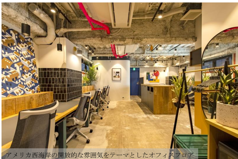
アメリカ西海岸の開放的な雰囲気をテーマとしたオフィスフロア