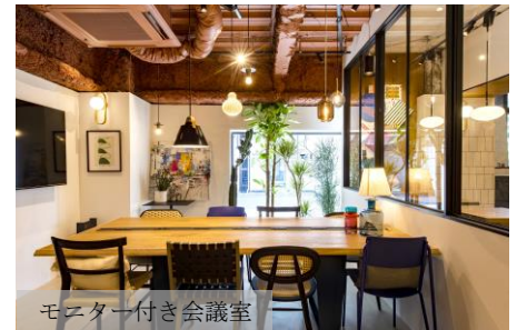
モニター付き会議室