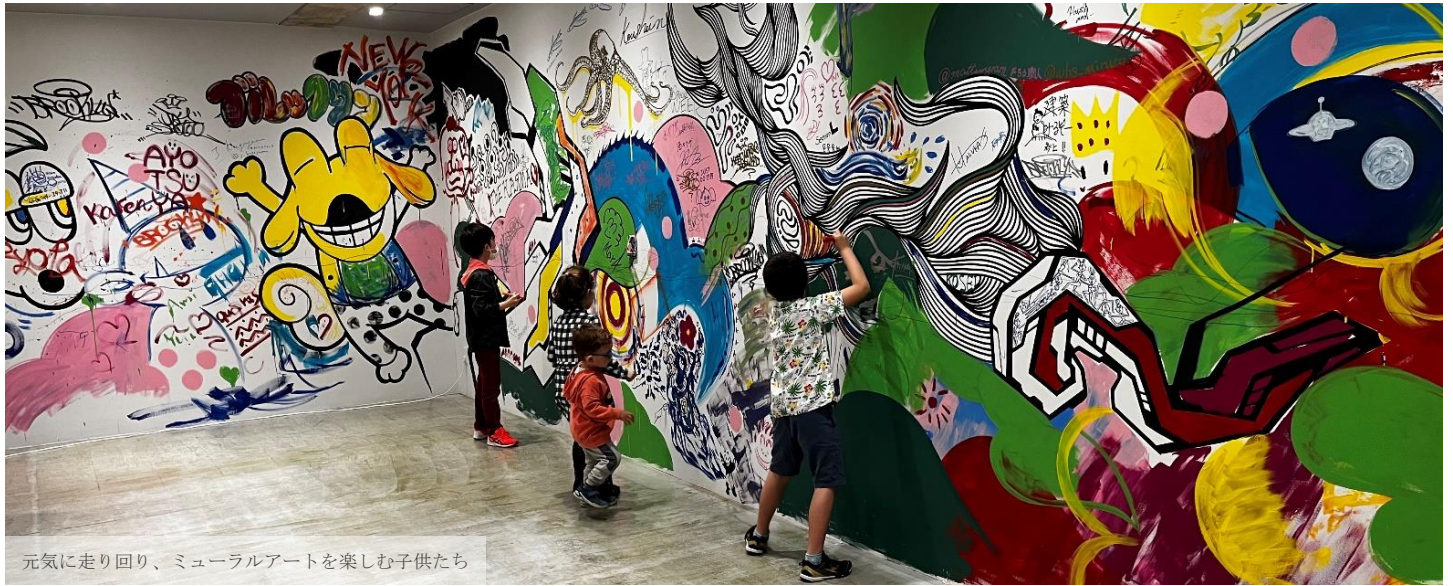
元気に走り回り、ミューラルアートを楽しむ子供たち