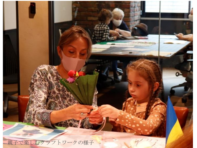
親子で楽しむクラフトワークの様子