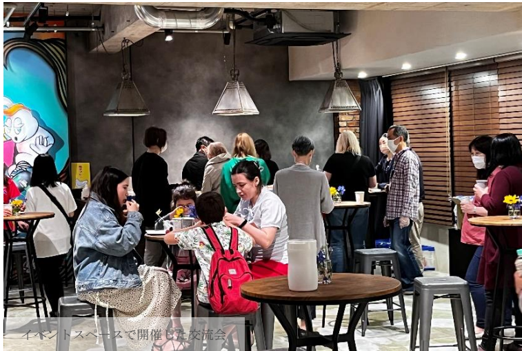
イベントスペースで開催された交流会