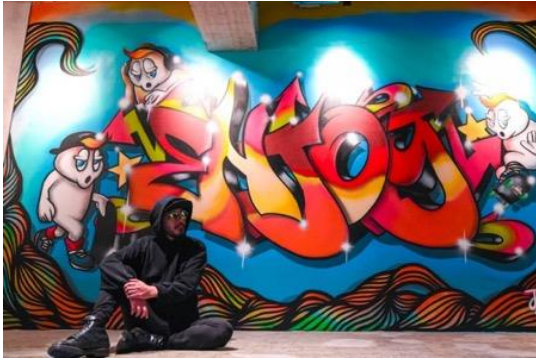
A YOTSUYA(エー ヨツヤ) 地下イベントスペースの作品前にて