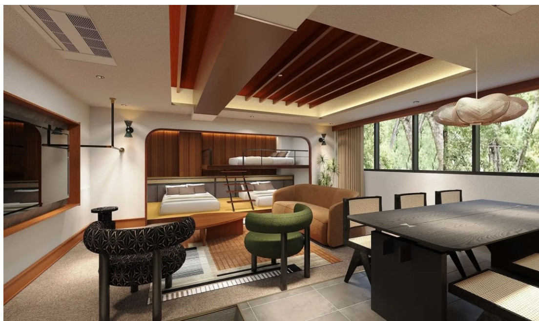
客室「APARTMENT SUITE」 ※画像はCGによるイメージパース