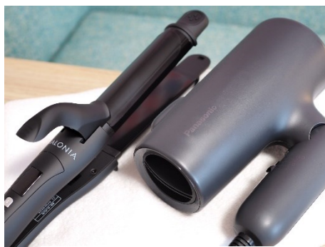
ヘアアイロンも全室常備

当ホテルでは、SDGs(持続可能な開発目標)の取り組みの一環として、プラスチック削減およびリサイクル促進を目的に、フロントに フリーアメニティコーナー を設置いたします。フリーアメニティコーナーには綿棒、コットン、ボディタオル、ヘアブラシ、ヘアゴム、カミソリ、ティーバッグをご用意しており、お客様には必要な分をお取りいただけます。この取り組みを通じて、使い捨てプラスチックの削減を進め、環境負荷の軽減に努めてまいります。