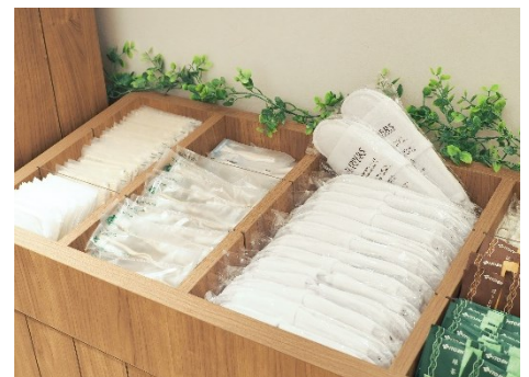
フリーアメニティコーナー