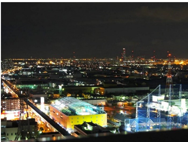
大阪ベイエリアの夜景

客室は 10 階から 19 階に位置しており、大阪ベイエリアやシティエリアの美しい夜景をご覧いただけます。エレベーターホールには旅行気分を盛り上げる壁画を設置いたしました。大阪をモチーフにしたアートで全 6 種類ございます。ご旅行の思い出にフォトスポットとしてもご利用ください。