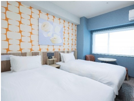
スタンダードツイン(18 m 2 )

明るくポップなデザインを基調としつつ、木のぬくもりを感じるインテリアを備え、ワクワクとリラックスを共存させる空間を演出しています。壁には大阪をモチーフとしたアートを飾り、その土地の空気を感じられる、温かみのある雰囲気の中、客室に生まれ変わりました。寝心地の良いサータ社製の快眠ベッド、ゆったりくつろげるソファとテーブル、加湿空気清浄機のほか、 フットマッサージャー や くつ乾燥機 を設置しており、旅の疲れを癒し快適にお過ごしいただけます。また、靴を脱いでお寛ぎいただけるファミリールームや和モダンフォースなど、お部屋タイプも充実しています。さらには、 50インチ以上の大型スマートTV を導入し、お客様ご自身のアカウントで各種有料コンテンツもお楽しみいただけます。