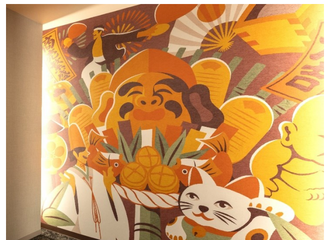
エレベーターホールの壁画