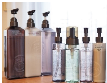
充実のアメニティ