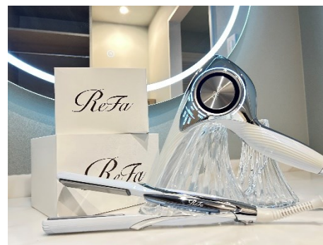
デラックスファミリールームは ReFa のドライヤーをご用意