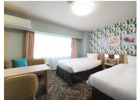
デラックスツイン(25 m 2 )