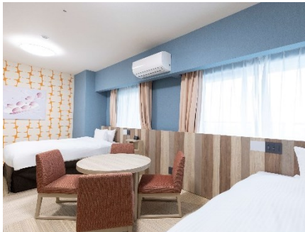
和モダンフォース(40 m 2 )