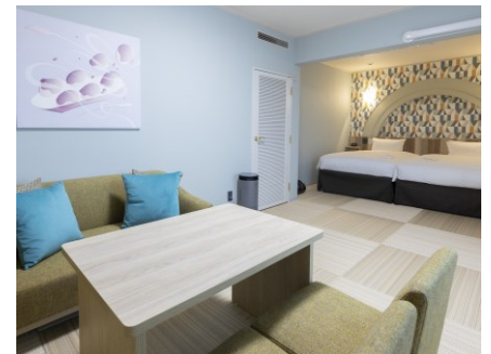
デラックスファミリールーム(40 m 2 )

客室は 10 階から 19 階に位置しており、大阪ベイエリアやシティエリアの美しい夜景をご覧いただけます。エレベーターホールには旅行気分を盛り上げる壁画を設置いたしました。大阪をモチーフにしたアートで全 6 種類ございます。ご旅行の思い出にフォトスポットとしてもご利用ください。