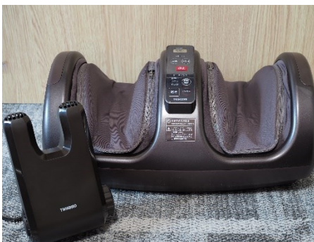
全室にフットマッサージャー、くつ乾燥機