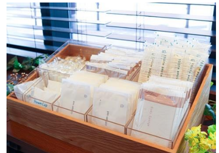
フリーアメニティコーナー