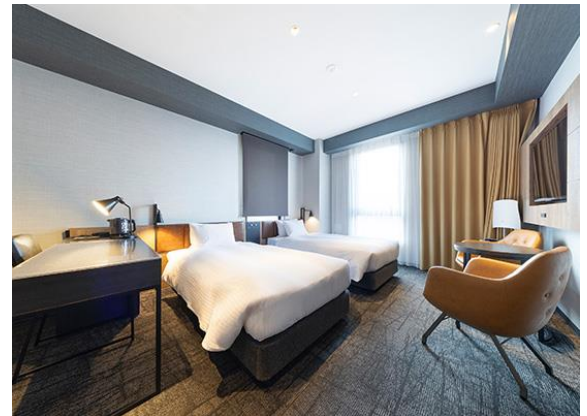
「スイートルーム」※ユニバーサルルーム利用可