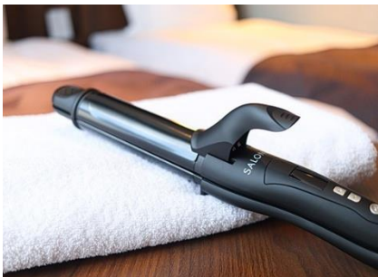
ヘアアイロンも全室常備

また、SDGs（持続可能な開発目標）の取り組みの一環として、プラスチック削減およびリサイクル促進を目的に、フロントに フリーアメニティコーナー を設置しています。綿棒、コットン、ボディタオル、ヘアブラシ、ヘアゴム、カミソリ、ティーバッグなどを取り揃え、必要な分だけお取りいただくことで、環境負荷の軽減に努めています。