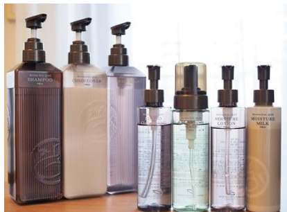
バスアイテムと基礎化粧品