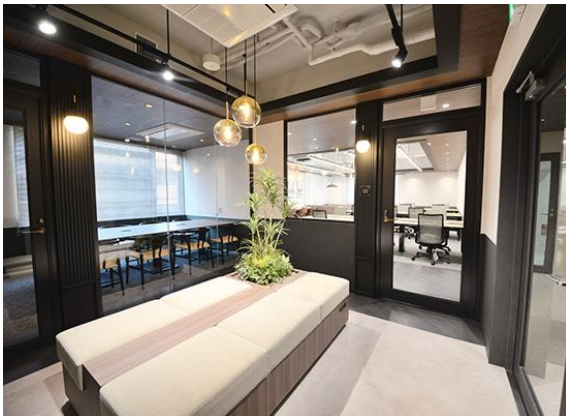
9階 会議室と執務室から自然光が差し込むラウンジ