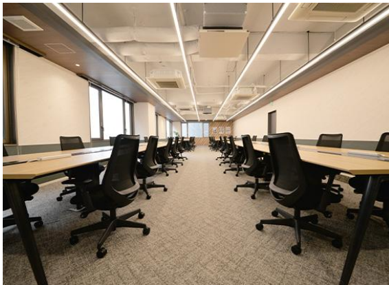
6階 デスクとチェアを備えた執務室