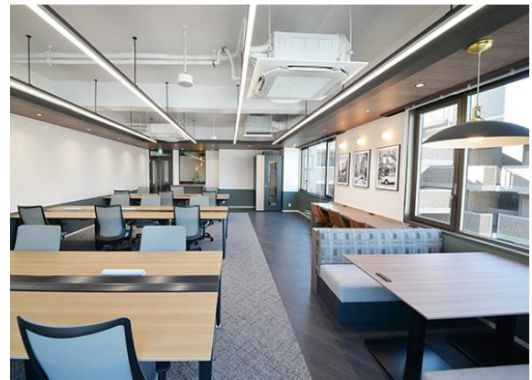
9階 ファミレスブースも備えた執務室