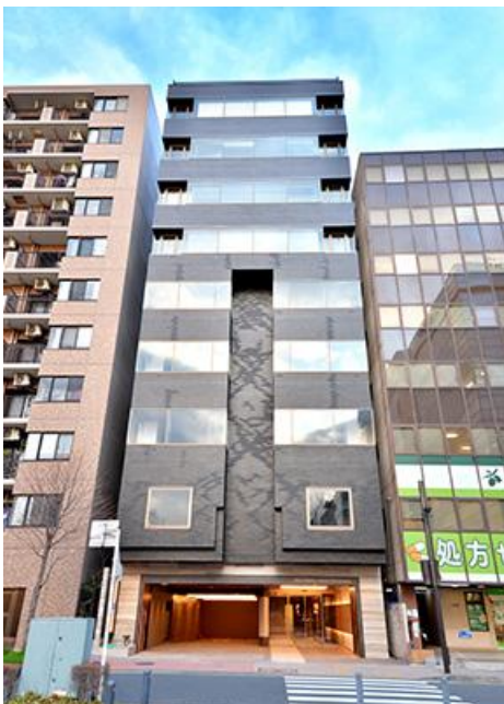
「THE PORTAL SHIN-YOKOHAMA」外観

「THE PORTAL SHIN-YOKOHAMA」は、企業の成長フェーズに応じて柔軟にオフィス規模を選択できる構成とし、横浜の地元企業の事業成長はもちろん、地方に本社を置く企業の首都圏進出や拠点拡大を支えるオフィスビルとして整備しました。