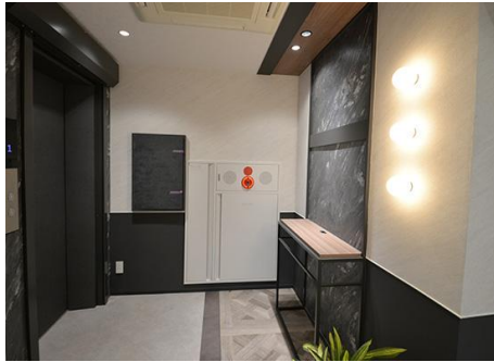
エレベーターホールに設置した受付(4～6階)