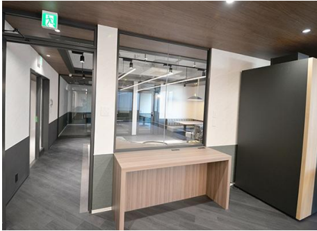
アースコンセント付パントリーを備えた執務室