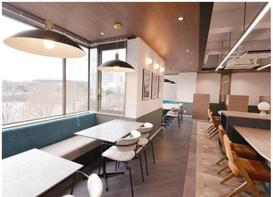
新横浜駅前公園を望む5階インナーラウンジ