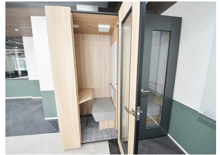
8階 テレカンブース