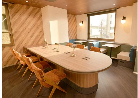
2階 フリーアドレス席を備えたインナーラウンジ