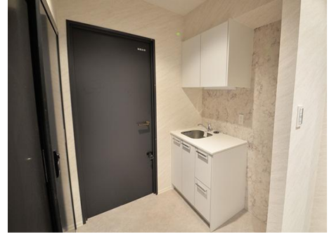
各フロアに備えたミニキッチンと備蓄倉庫