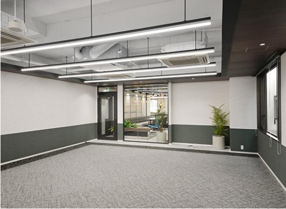
2階 採光を確保した執務室