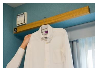
洗濯物を干せるハンガーラック