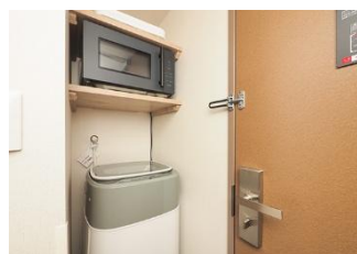
洗濯機、電子レンジ、2 ドア冷蔵庫を完備（ユニバーサルルーム 1 室除く）