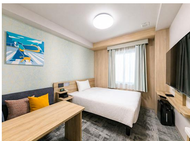
足を伸ばしてくつろげるソファセット付きのダブルルーム

「たびのホテル宇都宮ゆいの杜」は、自社ホテルブランド「サンフロンティアホテルズ」のカジュアルブランド「たびのホテル（TABINO HOTEL）」として栃木県に初出店いたします。