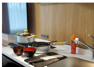
調理器具のお貸出し