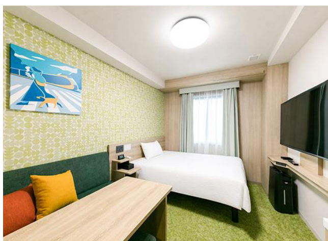
キッチン付きダブルルーム

電子レンジ/2 ドア冷蔵庫/洗濯機/55 インチスマートテレビ/加湿機能付き空気清浄機